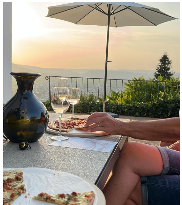
Entspannung unterm Sonnenschirm mit Blick über die wunderschöne Moselschleife.

wir meist Platz für einige Gästebautos und etliche Fahrräder. Bei Strommangel können wir ihr E-Bike gerne etwas aufladen. Wir freuen uns auf ihren Besuch.